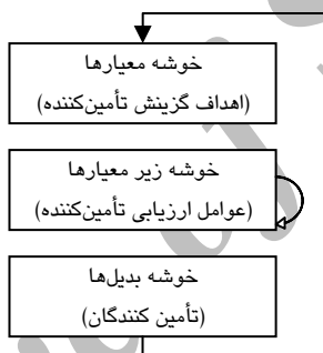
شکل ۱ مدل تعدیل‌شده سیستم بازخورد

مدل فرایند تحلیل شبکه‌ای از یک شبکه یا تعدادی شبکه تشکیل می‌شود. مدل‌های فرایند تحلیل شبکه‌ای به دو دسته قابل تقسیم‌اند: مدل سیستم بازخوردی ۱ و مدل سیستم سری ۲ [۴۰]، صص ۶۷۷-۶۸۳]. در مدل سیستم بازخوردی، خوشه‌های ارزیابی به نوبت و به طور متوالی، همانند سیستم شبکه‌ای به هم متصل می‌شوند. مدل این مطالعه، مدل سیستم بازخوردی است، اما وابستگی‌های درونی، خوشه زیر معیارها را مجاز می‌شمارد (شکل ۱). در این مدل پیکان حلقوی شکل نشان‌دهنده وابستگی‌های درونی است.