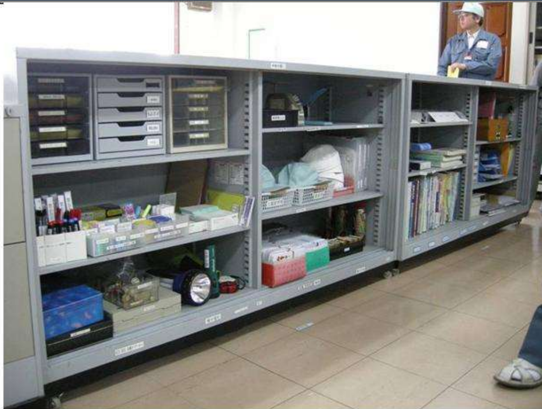
5S – all material identified and in its place. In the furniture, the wheels to facilitate moving.