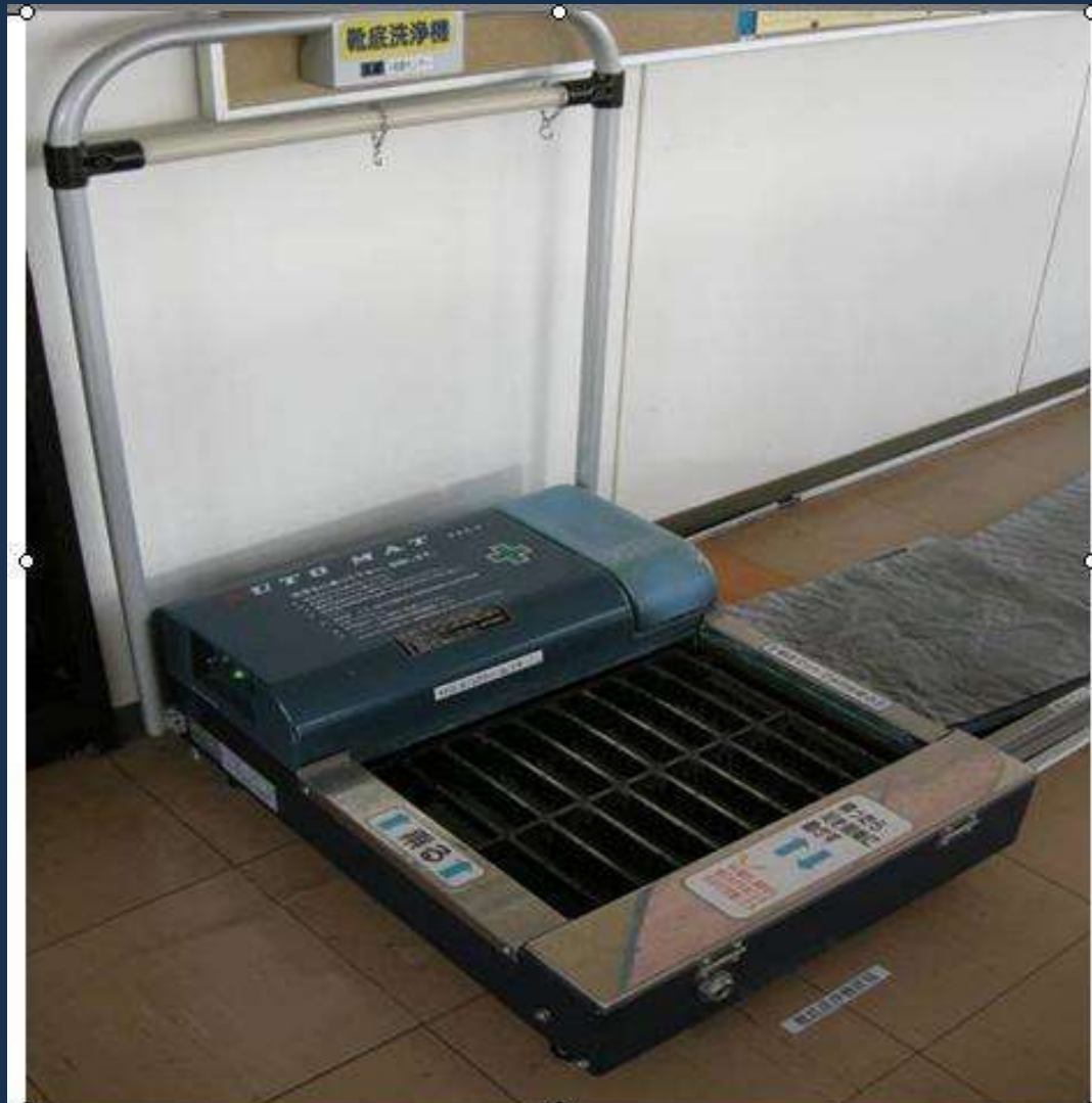
Device to clean foot. Before come in the production hall, everybody must clean the foot