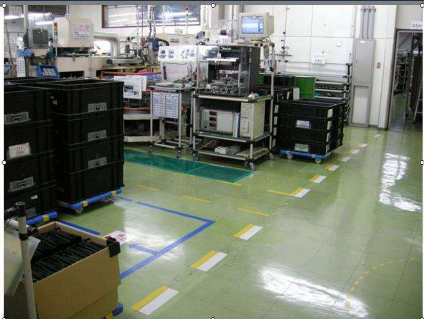
Floor identification. Which colour has a meaning, Very clear floor.