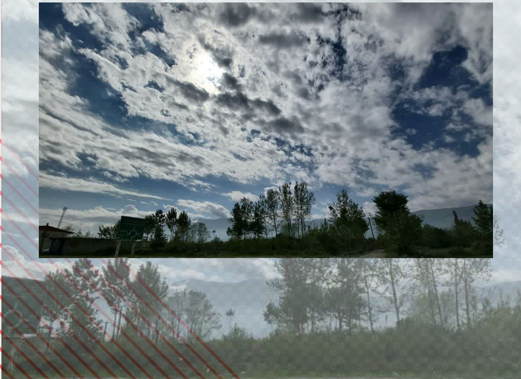
گلوگاه - مازندران

سافتی آمدنم عید مبارک است و آتش مواعید که کردی مرود از یاد است گشتم که در اینمیت ایام فراق بر گرفت ز حرفانم دل و دل می داد است